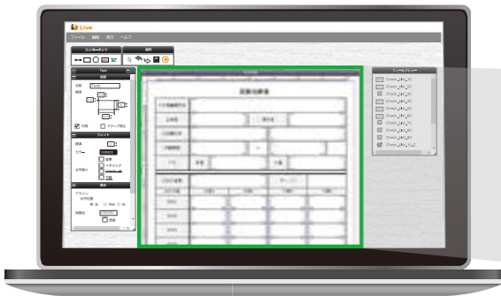
ブラウザ上で直感的にレイアウト